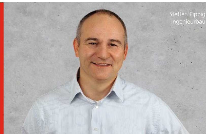
Steffen Pippig Ingenieurbau

Das Bessere verdrängt das Gute: Die MEVA gilt als Innovationsführer und Impulsgeber der Schalungsbranche mit 40 Standorten in 25 Ländern auf 5 Kontinenten und 10 Logistik-Centern weltweit. Als Komplettanbieter bietet die MEVA Schalungslösungen für jedes Bauunternehmen und jedes Bauprojekt – von Fundament bis Hochhaus, von Einkaufszentrum bis Tunnel. Eine Sonderstellung in der Branche nimmt die MEVA ein, weil sie sich von der Sperrholzplatte als Schalungshaut »befreit« hat und auf eine 100 % holzfreie Vollkunststoff-Platte (die solange hält wie der Rahmen) umgestellt hat. Spezialgebiete des Unternehmens sind Architekturbau und Sichtbeton, Sonderformen, Industrie- und Wohnungsbau, Ingenieur- und Infrastrukturbau sowie Klettertechnik, auch im Hochhausbau.