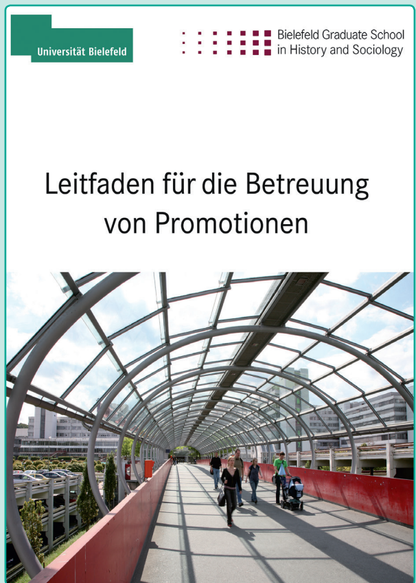
Abb. 2: Titelseite des Leitfadens der BGHS

Offen war zunächst, wie verbindlich das zu entwickelnde Format sein sollte: Sollten es Vorschläge, Standards, Empfehlungen oder Regelungen für die Promotionsphase werden? Die Überlegungen der Arbeitsgruppe führten zur Erkenntnis, dass Standards bei den Beteiligten eher Ängste vor Vereinheitlichung der Betreuung schüren und Regelungen oder Empfehlungen eher Widerstände auslösen würden. Deshalb beschloss man einen Leitfaden zu entwickeln, der einen selbstbindenden Charakter haben, aber eine Standardisierung oder Reglementierung der Promotionsphase vermeiden sollte. Infolgedessen erarbeitete die Arbeitsgruppe einen Leitfaden, der Betreuerinnen und Betreuern wie auch Promovierenden Hinweise geben sollte, wie das Betreuungsverhältnis gestaltet werden könnte. Der Leitfaden ist als praktische Handreichung konzipiert, wie ein Arbeitsbündnis von Promovierenden und Betreuungspersonen gefestigt werden kann, wie frühzeitig gegenseitige Erwartungen geklärt und Arbeitsabsprachen verbindlich gestaltet werden können, um auf diese Weise Betreuungskonflikte zu vermeiden.